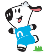
Campo a través